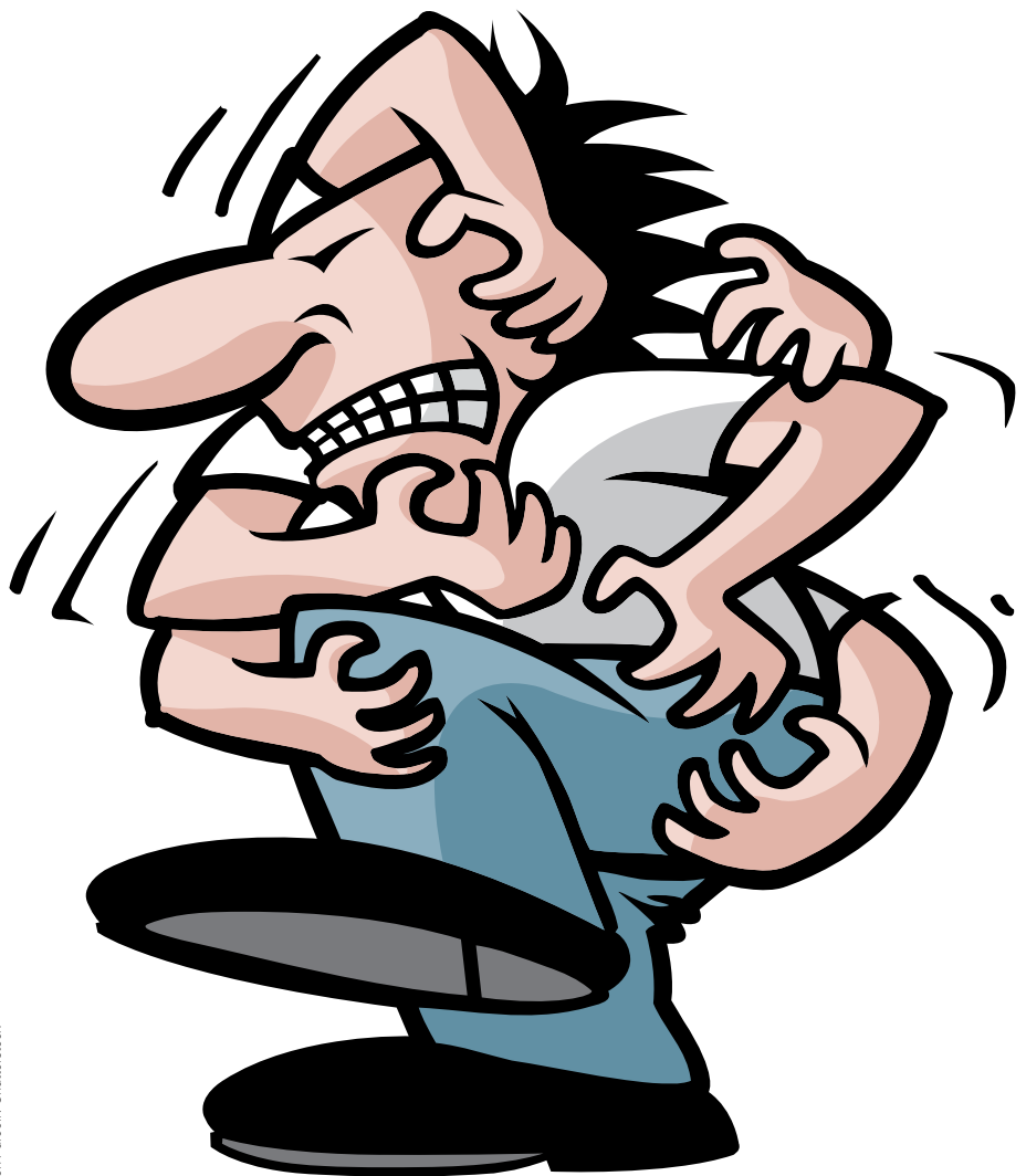
Abb. 2: Pruritus ist ein extrem belastendes Symptom.